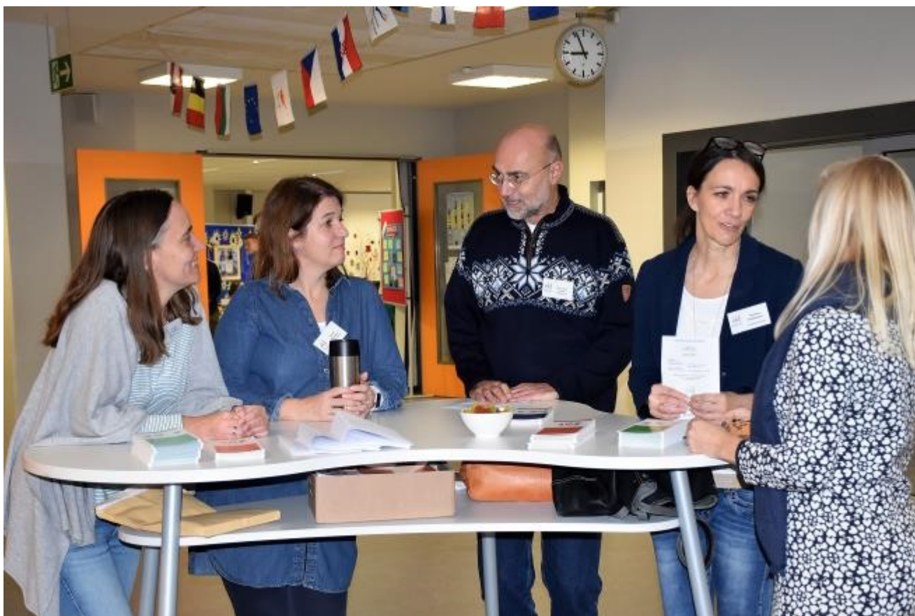
Schulelternbeirat und Schulleitung gemeinsam am Infostand (Tag der offenen Tür)

Ich möchte Ihnen einen kurzen Überblick über die Themen geben, mit denen sich der Schulelternbeirat momentan beschäftigt. Ein Punkt, den wir mit der Schulleitung und dem Personalrat zusammen adressieren wollen, betrifft die Überhitzung der Klassenräume in den oberen Stockwerken im Sommer. Mit den Reaktionen des Schulträgers, dem Kreis Mainz-Bingen, auf unsere Verbesserungswünsche sind wir leider bislang nicht zufrieden. Wir bleiben hier am Ball, um eine Verbesserung der Situation zu erreichen